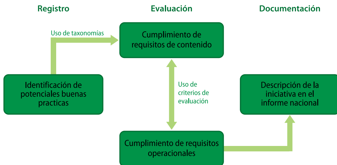
Diagrama 4 Etapas de identificación y análisis de buenas prácticas

Esta fase está compuesta de tres etapas: el registro, la evaluación y la documentación (véase el diagrama 4).