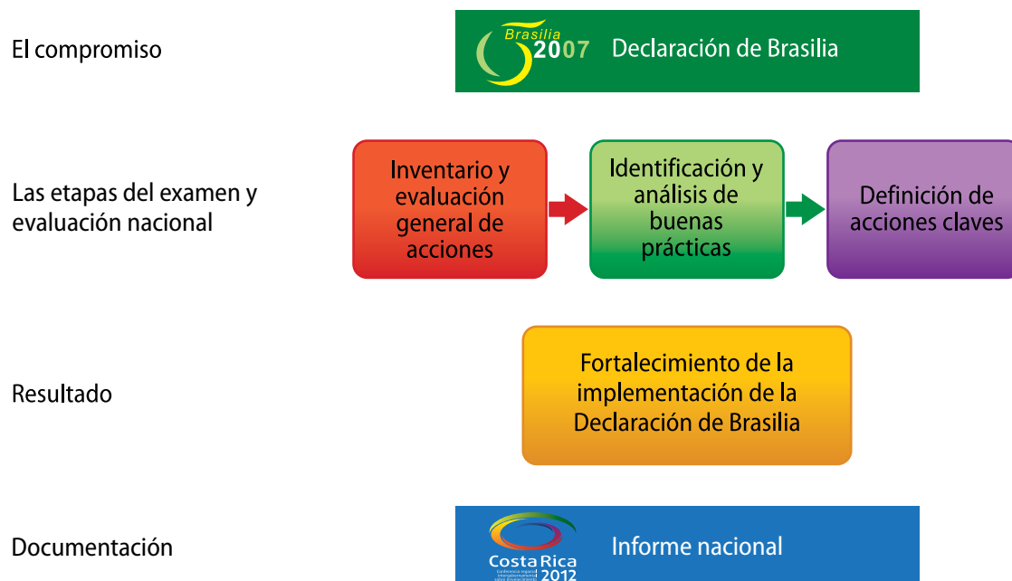
Diagrama 2 Etapas metodológicas para evaluar los avances nacionales en la implementación de la Declaración de Brasilia

El resultado de este proceso permitirá fortalecer la aplicación de la Declaración de Brasilia en los próximos cinco años, y servirá de insumo para la elaboración del informe nacional a presentar en la tercera Conferencia regional intergubernamental sobre envejecimiento de 2012.