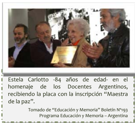
Estela Carlotto -84 años de edad- en el homenaje de los Docentes Argentinos, recibiendo la placa con la inscripción “Maestra de la paz”.

Tomado de “Educación y Memoria” Boletín N°193 Programa Educación y Memoria – Argentina