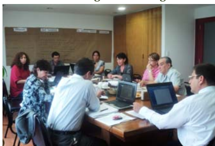
Reunión de coordinación Santiago de Chile, febrero-29 a marzo 2 de 2012