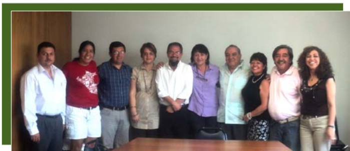
Integrantes del Comité Organizador Reunión Regional Sociedad Civil Madrid +10: Del Plan a la Acción